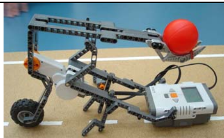
Εικόνα 7: Ο καταπέλτης

Ο καταπέλτης: Ο καταπέλτης αποτελείται από ένα κινούμενο 'χέρι' το οποίο εκτοξεύει μία μπάλα με σκοπό να 'βάλει καλάθι'. Η μπάλα μπορεί να εκτοξευθεί από διαφορετικές γωνίες ανάλογα με την απόσταση που χωρίζει τον καταπέλτη από το καλάθι. Πειραματισμοί με την μηχανή αυτή μπορούν να βοηθήσουν στη διερεύνηση εννοιών που σχετίζονται με τη βολή.