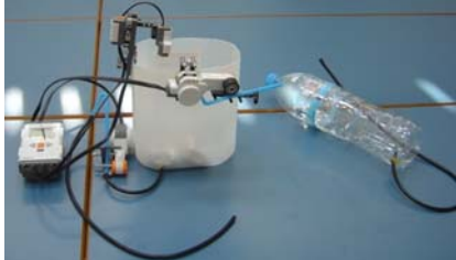
Εικόνα 3: Αυτόματο σύστημα άρδευσης

Αυτόματο σύστημα άρδευσης: Η ρομποτική κατασκευή μπορεί να ελέγξει τη στάθμη του νερού μέσα στο δοχείο συλλογής και να ενεργοποιήσει την άρδευση μίας περιοχής με συγκεκριμένα κριτήρια (θερμοκρασία, χρόνο, επίπεδα φωτός στο περιβάλλον).