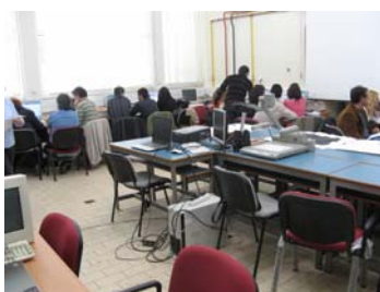
Εικόνα 1: Εργασία σε ομάδες

Θεωρητικό πλαίσιο: Κατά τη διάρκεια αυτής της ενότητας έγινε η επεξεργασία των παιδαγωγικών αρχών στις οποίες στηρίχθηκε η αξιοποίηση της εκπαιδευτικής ρομποτικής μέσα στο πρόγραμμα TERECOP και ειδικότερα: του εποικοδομιστικού και του κατασκευαστικού εποικοδομιστικού (constructionism). Αξιοποιώντας τη γνώση και εμπειρία των συμμετεχόντων ο επιμορφωτής τους ζήτησε να μελετήσουν και να σχολιάσουν σε ομάδες των 3-4 ένα μέρος ενός σχετικού άρθρου (Tsang 2002), να αναρτήσουν στο forum της η-τάξης μία μικρή περίληψη αυτού που μελέτησαν καθώς και των σχολίων τους, και στη συνέχεια να τα παρουσιάσουν στην ολομέλεια. Ο εκπαιδευτής συνόψισε τα κύρια σημεία των παρουσιάσεων παρέχοντας ανατροφοδότηση στις ομάδες και πρόσθεσε την δική του άποψη δίνοντας έμφαση στη σχέση των παιδαγωγικών αυτών αρχών με την εκπαιδευτική ρομποτική. Σχετικά άρθρα και δικτυακοί σύνδεσμοι προτάθηκαν στους επιμορφούμενους για περαιτέρω μελέτη (Ackermann E., 2001, Resnick, M., 2002).