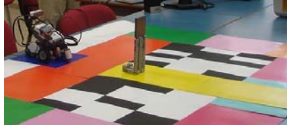
Εικόνα 4: Οργανώνοντας τους θεατές σε ένα αμφιθέατρο

Οργανώνοντας τους θεατές σε ένα αμφιθέατρο: Πρόκειται για έναν αυτόματο καταγραφέα και καταμέτρηση ελεύθερων θέσεων σε ένα αμφιθέατρο. Η λειτουργία του στηρίζεται στην αναγνώριση του χρώματος της ελεύθερης θέσης και στην κίνηση πάνω σε μία συγκεκριμένη διαδρομή.