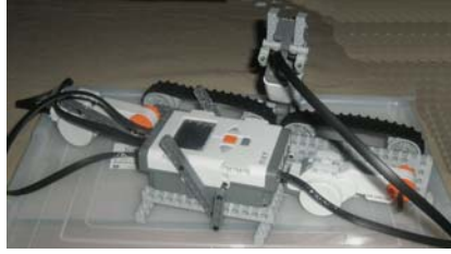
Εικόνα 2: Διαλογέας ανακυκλώσιμων απορριμμάτων

απορριμμάτων: Οι μαθητές καλούνται να κατασκευάσουν μία μηχανή διαλογής απορριμμάτων. Ο αισθητήρας φωτός της μηχανής ελέγχει το χρώμα της σακούλας σκουπιδιών που τοποθετείται εμπρός του και οδηγεί τη σακούλα στον κατάλληλο κάδο (ανακύκλωσης ή μη) ενεργοποιώντας τον ανάλογο μίαντα.