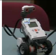
Εικόνα 7: Το κινούμενο όχημα

Το κινούμενο όχημα: Η συνθετική εργασία αυτή απευθύνεται σε μαθητές δημοτικού. Οι μαθητές καλούνται σταδιακά να προγραμματίσουν το αυτοκίνητο αυτό έτσι ώστε να στρίβει αριστερά και δεξιά με την βοήθεια αισθητήρων, να κινείται πάνω σε μία συγκεκριμένη διαδρομή και να κινείται πάνω σε μια τυχαία διαδρομή.